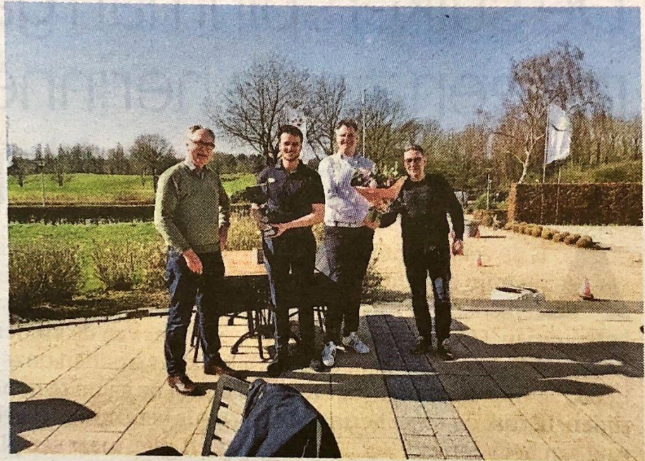
▲ NIJMEGEN/GROESBEEK Op 15 maart hield het Wijn- gilde Nijmegen een horecaproeverij. veertien restau- rants deden mee. Winnaar werd Green 46, tweede De Meesterproef, derde Glaswerk en Goed Volk.